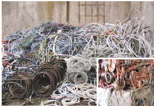
Verschiedene NE Metall und Eisenabfälle