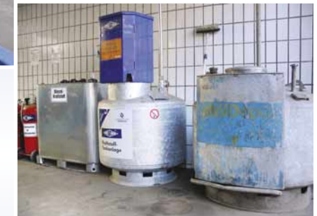
Spezialgeräte zur Trockenlegung und Lagerung