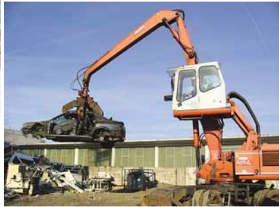
Moderne Umschlags- technik