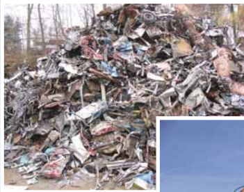
Unser Außenlager für Eisenschrott