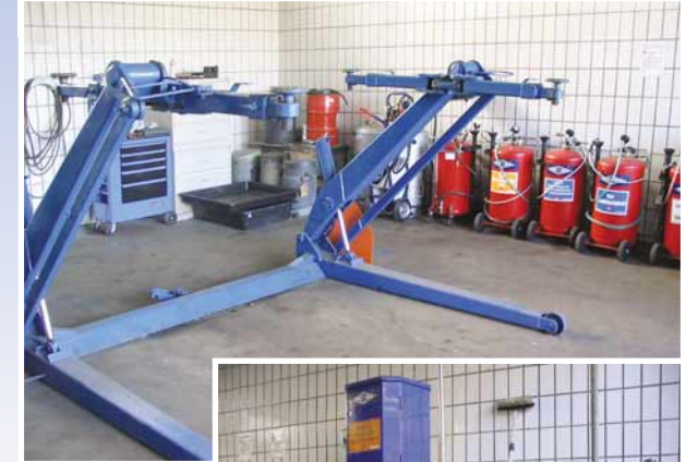
Entnahme von Betriebsflüssigkeiten