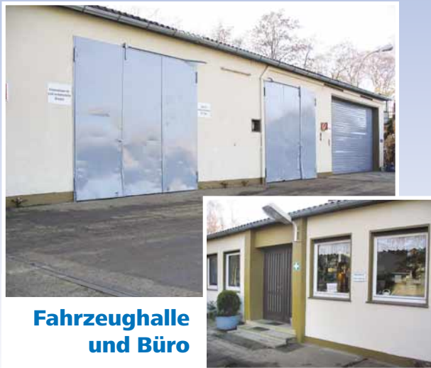
Fahrzeughalle und Büro

Firmengründung 1939, Mitglied im BDSV, Entsorgungsfachbetrieb nach § 52 Krw-/ AbfG, behördliche Transportgenehmigung, Zertifizierte Autoverwertung nach Altautoverordnung